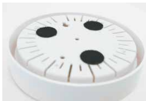
固定面ファスナー貼付け済