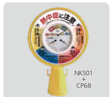
NKS01 + CP68